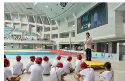
平成 25 年度会場の様子