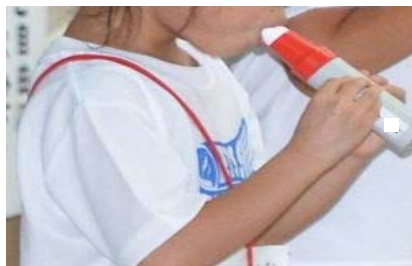
ピークフローメーターの実技指導（参考 2）