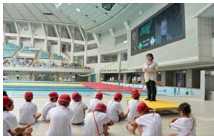
平成 26 年度の会場の様子

(3) 当日プログラム 別紙「平成 27 年度水泳記録会（関西大会）」募集チラシを御参照ください。