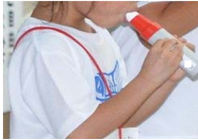
ピークフローメーターの実技指導 (参考 2)