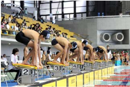
平成 26 年度会場の様子