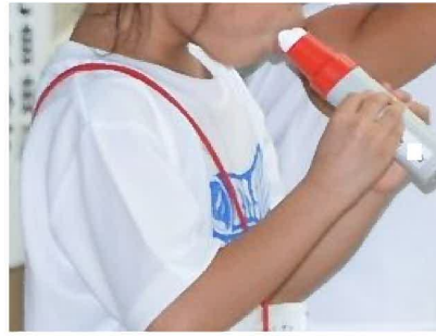
ピークフローメーターの実技指導 (参考 2)