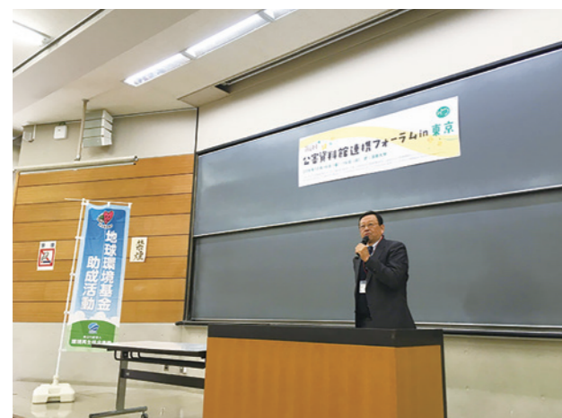
「公害資料館連携フォーラム」を毎年各地で開催

あおぞら財団が事務局を務め、公害資料館連携フォーラムを毎年開催し、「公害を伝える、公害から学ぶ」ということは何かを議論しています。また、議論を基に「共通展示パネル」を作成し、公害の経験から学ぶ公害教育を広げています。