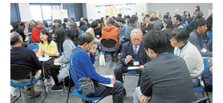
ワークショップを通じて各主体の共通点を探していく

ツールの一つとして活用しています。こうした協働により成果を得られるまでのプロセスは、「協働ガバナンス」としてモデル化され、公害教育を発信する活動はさらに進化していきます。