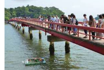
福浦橋から砂団子を投げ入れることで、観光客も藻場の再生に参加できる