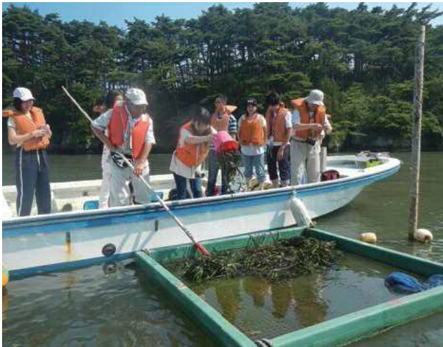
高校生たちの環境教育も兼ね、浮島に種をつけたアマモを入れて沈め熟成と播種をおこなう