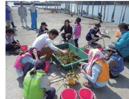
水族館や漁師さんも参加して、子どもたちと移植苗づくり

藻場の再生と共に、そこに関わる人の輪も広がっている点が素晴らしいです。アマモを知ってもらい、アマモを助ける人を増やしていく。地元の方から観光客まで、誰でもアマモとつながれる活動を今後も期待しています！