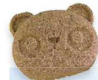
砂団子は親しみやすい動物のかたちに