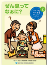
●子どものぜん息&アレルギーシリーズ

ここで掲載しているパンフレットの他、数多くのパンフレットを当機構のホームページにて紹介しています。パンフレットは全国へ無料で発送していますので、お気軽にお問い合わせください。お申し込みはTEL・FAXまたはホームページよりお願いします。