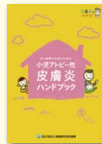
●小児アトピー性皮膚炎ハンドブック