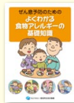
●よくわかる食物アレルギーの基礎知識