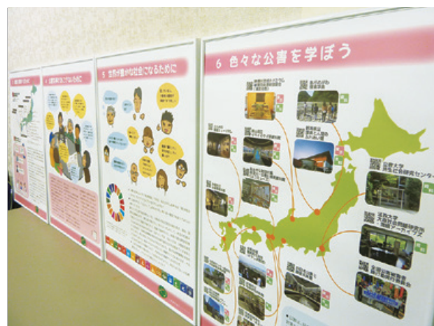
公害に関わる人々の想いが詰まった「共通展示パネル」