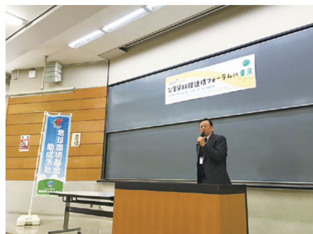
「公害資料館連携フォーラム」を毎年各地で開催

あおぞら財団が事務局を務め、公害資料館連携フォーラムを毎年開催し、「公害を伝える、公害から学ぶ」ということは何かを議論しています。また、議論を基に「共通展示パネル」を作成し、公害の経験から学ぶ公害教育を広げています。