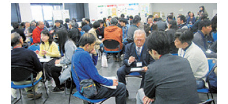
ワークショップを通じて各主体の共通点を探していく

ツールの一つとして活用しています。こうした協働により成果を得られるまでのプロセスは、「協働ガバナンス」としてモデル化され、公害教育を発信する活動はさらに進化していきます。