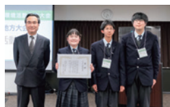
SDGs活動特別賞 宮城県志津川高等学校