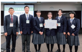
高校生が選ぶ特別賞 岩手県立花巻農業高等学校

宮城県農業高等学校 作物部門 岩手県立花巻農業高等学校 ソーセージ研究班 青森県立名久井農業高等学校 環境研究班 青森県立三本木農業恵拓高等学校 チーム・COW飼う'S 山形県立山形西高等学校 放課後実験倶楽部 宮城県志津川高等学校 自然科学部 青森県立名久井農業高等学校 環境システム科 草花班 青森県立むつ工業高等学校 設備・エネルギー科 地中熱融雪研究班 岩手県立遠野緑峰高等学校 生産技術科 野菜・果樹研究班 秋田県立新屋高等学校 理科研究部 秋田県立能代松陽高等学校 チーム松陽 秋田県立大館鳳鳴高等学校 化学部 宮城県多賀城高等学校 SS科学部ヤスデ班