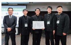
先生が選ぶ特別賞 青森県立三本木農業恵拓高等学校