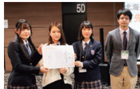
先生が選ぶ特別賞 市立札幌開成中等教育学校