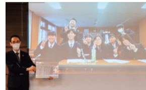
協賛企業特別賞 北海道大野農業高等学校