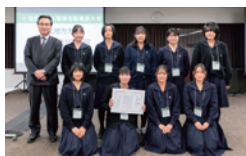
協賛企業特別賞 山形県立山形西高等学校