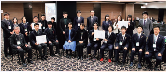
北海道地方大会 記念写真

2022年12月、全国8か所で「第8回 全国ユース環境活動発表大会 地方大会」が開催されました。たくさんの応募をいただき、書類選考を経て全国合計85高校が地方大会に出場しました。地方大会（新型コロナウイルスの感染防止対策をとり、実施しました。）