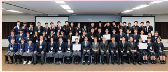
東北地方大会 記念写真