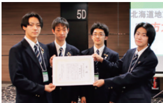
地方大会最優秀賞 北海道士幌高等学校