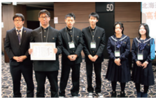
高校生が選ぶ特別賞 北海道羽幌高等学校

北海道士幌高等学校 環境班 北海道羽幌高等学校 SBFプロジェクトチーム 北海道美幌高等学校 環境改善班 市立札幌開成中等教育学校 PlaCler 北海道大野農業高等学校 ボランティア部・果樹専攻班