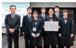
審査委員特別賞 青森県立名久井農業高等学校