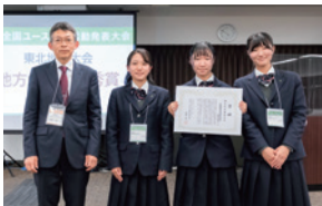
地方大会最優秀賞 宮城県農業高等学校