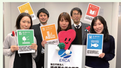
全国ユース環境ネットワーク事務局

〈主催〉全国ユース環境活動発表大会 実行委員会 (環境省/独立行政法人環境再生保全機構/国連大学サステナビリティ高等研究所) 〈後援〉読売新聞社 〈協賛〉キリンホールディングス株式会社、協栄産業株式会社、SGホールディングス株式会社、株式会社タニタ