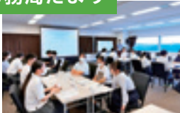
東北地区 高校生SDGs セミナーの様子(詳細はP8)

私たちユース事務局は、さまざまな機会を通じて、環境活動に取り組むユース世代のみなさんを応援しています。