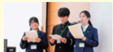
前年・発表風景 熊本県立熊本農業高等学校

〈開催日〉2024年2月3日(土)~4日(日) 〈出場高校〉各地方大会 2高校選考 ×8地方…合計16高校