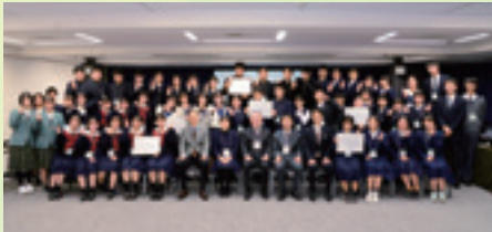
九州・沖縄地方大会