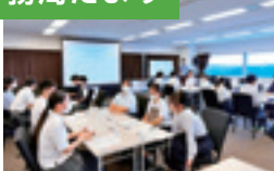
東北地区 高校生SDGs セミナーの様子(詳細はP8)

私たちユース事務局は、さまざまな機会を通じて、環境活動に取り組むユース世代のみなさんを応援しています。