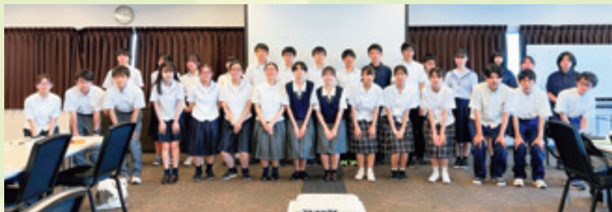
会場参加のみなさん