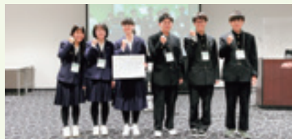
中国地方大会 表彰