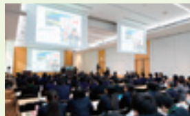
〈前年度写真〉全国大会 会場風景