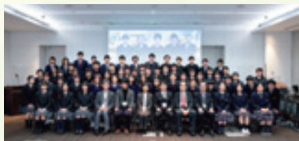
関東地方大会 記念写真

(スペースの関係上、写真は3点、各地方大会記載の高校は2校を抜粋して掲載しています。)