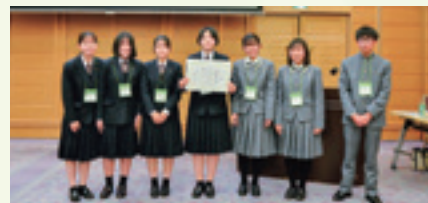
四国地方大会 表彰