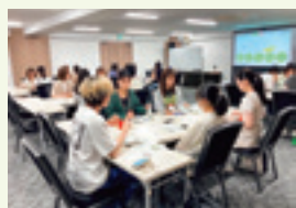
交流ミーティング