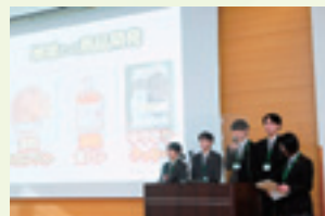
〈前年度写真〉発表風景 長野県佐久平総合技術高等学校

「全国ユース環境活動発表大会」は、高校生のみなさんが取り組む環境活動やSDGs活動を全国に向かって 発表 する大会です。日ごろの活動の成果を発表し、たくさんの人たちに伝えてください!表彰式では環境大臣賞をはじめ出場全校に賞状の授与をいたします。また、この大会は、他校との 交流 を大切にしています。他校の活動を知ることは大変に参考になりますよ!