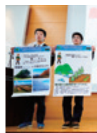
〈前年度写真〉発表風景 北海道士幌高等学校