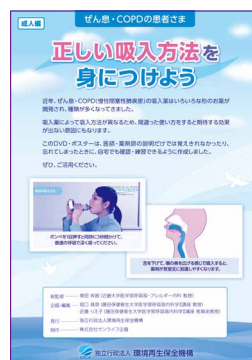
正しい吸入方法を身につけよう (DVD)