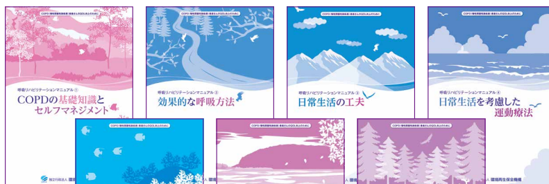
【COPD患者さん向け】呼吸リハビリテーションマニュアルシリーズ

●パンフレット申込フォーム https://www.erca.go.jp/yobou/pamphlet/form/index.html