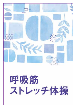
呼吸筋ストレッチ体操