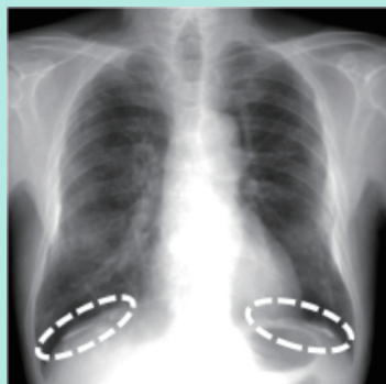
例1) 典型的石灰化胸膜プラーク