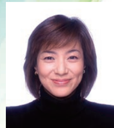
八木 亜希子 氏 フリーアナウンサー