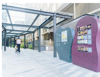
「ホテルメトロポリタン 川崎」の横の道をそのまま直進する