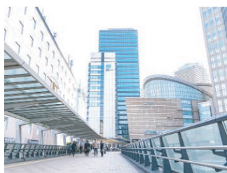
歩行者デッキを直進する