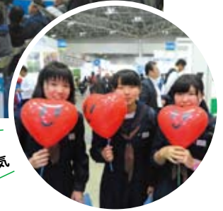
ききんちゃん風船が大人気