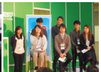
若手プロジェクトリーダーの成果発表会