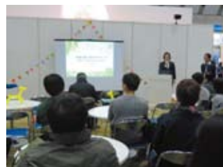
海外派遣研修の報告会