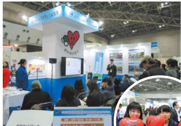
基金ブースでの「助成団体活動報告会」の様子