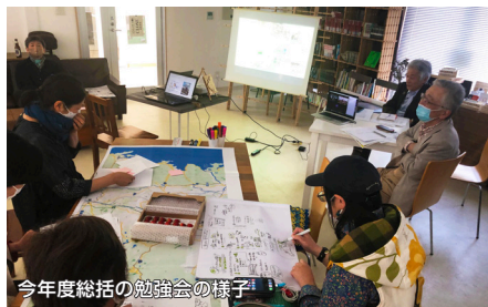
今年度総括の勉強会の様子