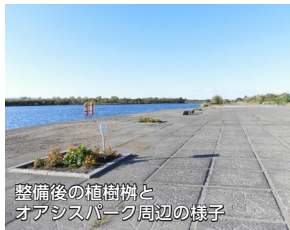
整備後の植樹樹と オアシスパーク周辺の様子