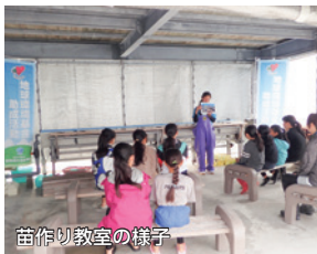
苗作り教室の様子