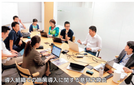
導入組織での施策導入に関する意見交換会