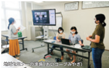
地域セミナーの準備 (あいコープみやぎ)