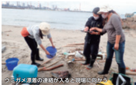
ウミガメ漂着の連絡が入ると現場に向かう