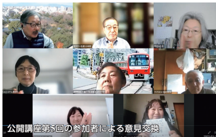
公開講座第5回の参加者による意見交換