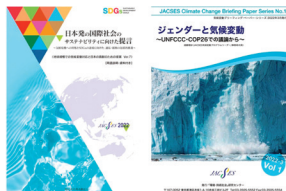
作成したレポート類の表紙

また、他団体と共同発表した「気候変動対策・施策におけるジェンダー平等の推進を求める声明」にも多くの賛同をいただいた。