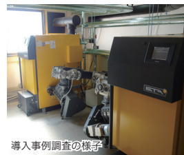
導入事例調査の様子

ウェブサイト「ISEPエネルギーチャート」を立ち上げ、自然エネルギー等の電力供給量や熱利用状況をグラフ化し一般にもわかりやすいよう可視化したサイトを構築した。2018年2月15日に一般公開し、3月末までに約17,000のページビュー数が得られた。