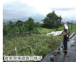
被害現場調査の様子