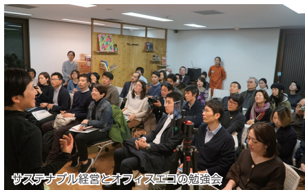
サステナブル経営とオフィスエコの勉強会