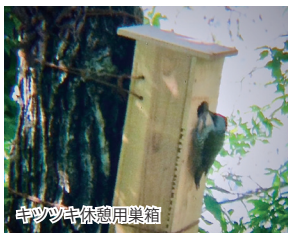
キツツキ休憩用巣箱

愛宕山の森が、森の遷移・生物多様性を体験的に学習できる場となる。絶滅危惧種が保護され、外来種が駆除され、自然の恵みを忘れず大切にすることを心がける人が街に溢れる。