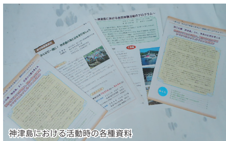
神津島における活動時の各種資料