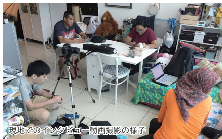
現地でのインタビュー動画撮影の様子