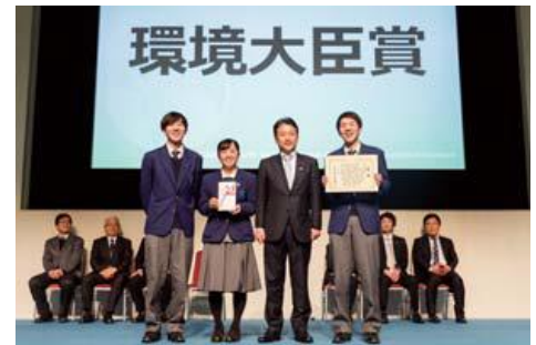
前年度 環境大臣賞 受賞風景