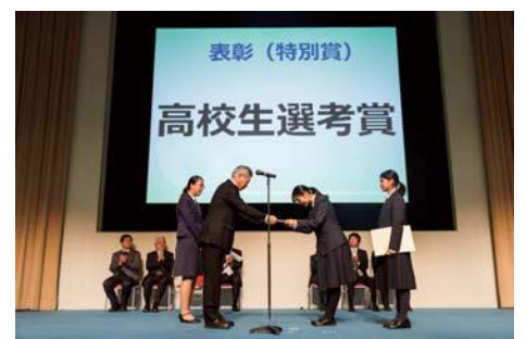
前年度 特別賞 受賞風景