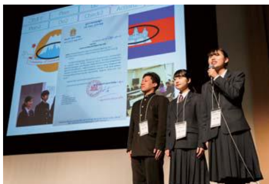
前年度 全国大会 発表風景