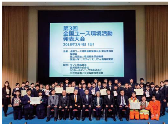
前年度 全国大会 記念撮影

この大会は、志を同じくする高校生やユースが一堂に会する「出会いの場」であり、また創造力を働かせて行う自らの環境活動を発表し、相互研鑽を行う場として実施しています。