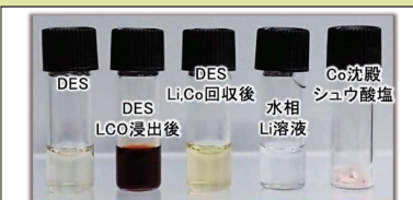
図3: 深共晶溶媒によるLIBの層積材(LiCoO 2 )からのレアメタル分離 深共晶溶媒を用いることで、LIBから、コバルト酸リチウム(LiCoO 2 )を浸出させ、そのあと、シュウ酸溶液に酸処理させるなどすることで、リチウム(Li)とコバルト(Co)を抽出することができた。 * 深共晶溶媒 (DES) を用いることで、抽出工程を省くことができる * 深共晶溶媒は、リチウムの抽出・逆抽出において、5サイクル以上の繰り返しにも問題がない

深共晶溶媒の分子設計によって、目的となる金属を選択的に溶かし出す、深共晶溶媒の調製が可能となります。このため、金属分離を目的とした様々な分野に導入できます。