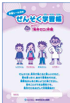
ぜんそく学習帳 「めざせ! 発作ゼロ」作戦