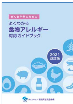
ぜん息予防のための よくわかる食物アレルギー 対応ガイドブック