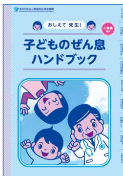
おしえて先生! 子どものぜん息ハンドブック