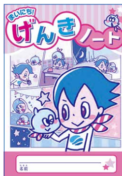
まいにち! げんきノート