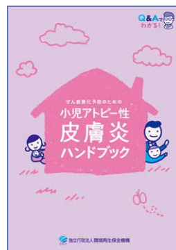
ぜん息悪化予防のための 小児アトピー性皮膚炎 ハンドブック