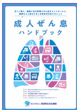
成人ぜん息ハンドブック