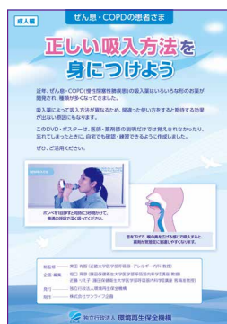
正しい吸入方法を身につけよう (DVD)