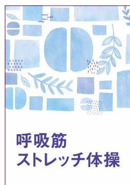
呼吸筋ストレッチ体操