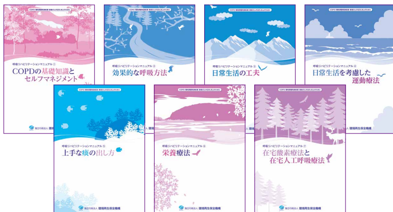
【COPD患者さん向け】呼吸リハビリテーションマニュアルシリーズ

●パンフレット申込フォーム https://www.erca.go.jp/yobou/pamphlet/form/index.html