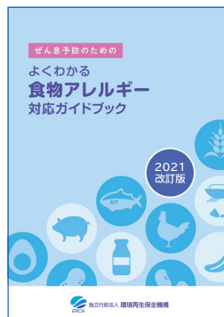
ぜん息予防のための よくわかる食物アレルギー 対応ガイドブック