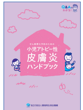
ぜん息悪化予防のための 小児アトピー性皮膚炎 ハンドブック