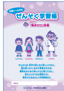
ぜんそく学習帳 「めざせ! 発作ゼロ」作戦