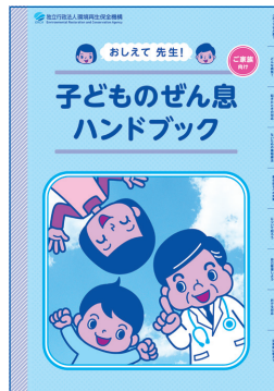
おしえて先生! 子どものぜん息ハンドブック