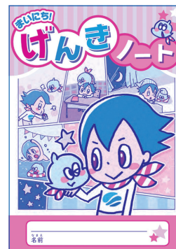
まいにち! げんきノート