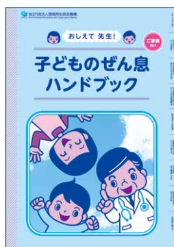
おしえて先生! 子どものぜん息ハンドブック