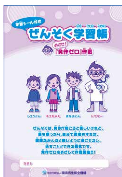
ぜんそく学習帳 「めざせ! 発作ゼロ」作戦