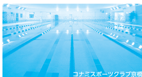
コナミスポーツクラブ京橋