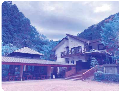
和泉市立青少年の家