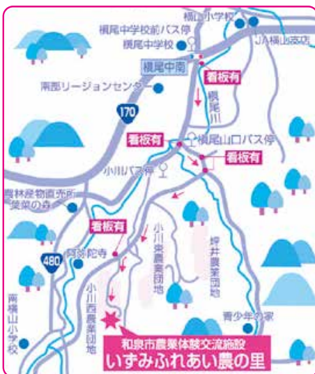
ふれあい農の里の地図