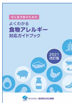
ぜん息予防のための よくわかる食物アレルギー 対応ガイドブック