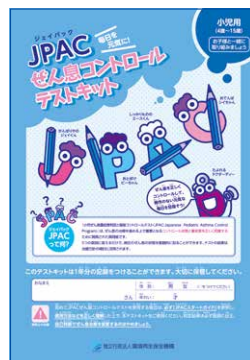
JPAC ぜん息コントロール テストキット (小児4歳～15歳用)