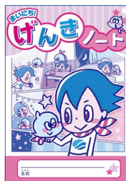
まいにち! げんきノート