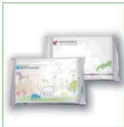
ポケットティッシュ