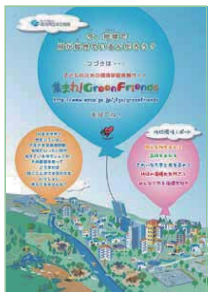
⑥「地球環境基金 子どものための環境 学習サイトの紹介」 サイズ：B2のみ