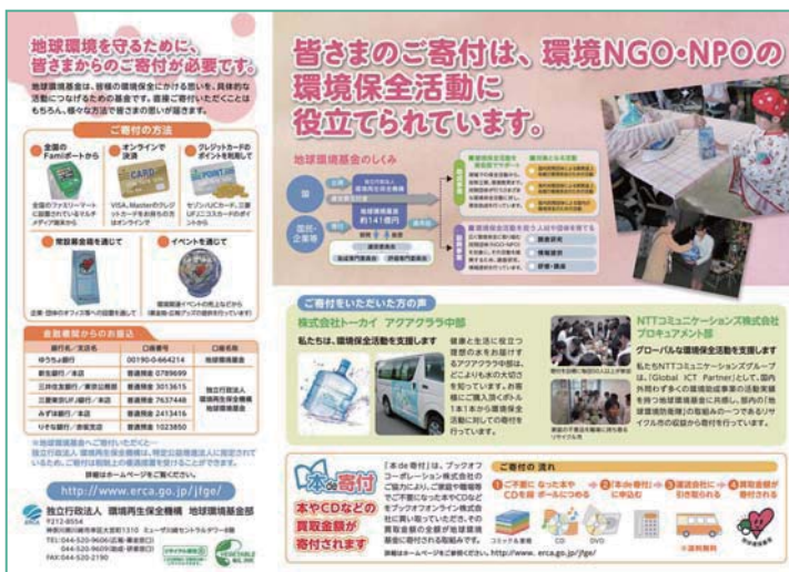
裏面 寄付の事例のご紹介など