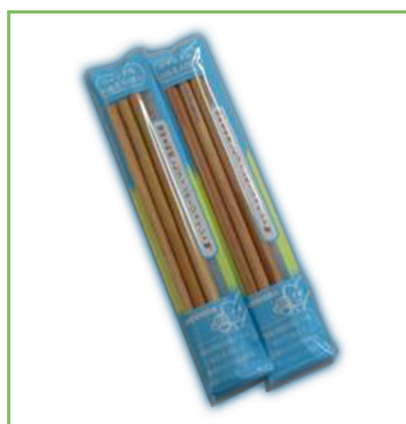
リサイクル色鉛筆