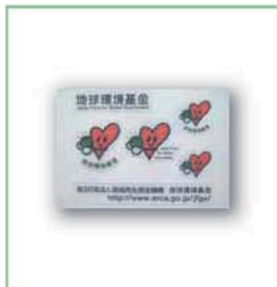
基金ちゃんシール