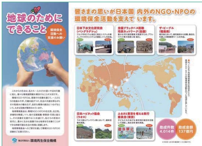
表面 地球環境基金の事業のご紹介