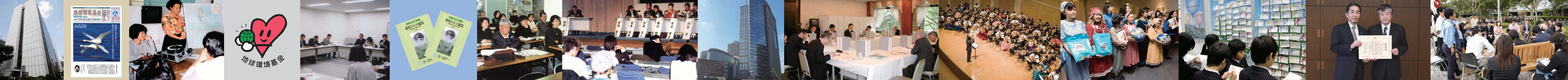
環境事業内に設置された地球環境基金(1993) The first JFGE Newsletter issued (1993) 初年度海外団体向けの助成は3件。その一つがフィリピンハリボン財団(1993) Haribon Foundation, one of the three recipients of the first subsidies for foreigners (1993) 応募数約2,000件の中から選ばれたシンボルマーク。盛岡市の松本勇三さんの作品(1994) JFGE symbol selected among over 2000 entries; work by Mr. Yuno Kashiwagi of Morioka City, Iwate Pref. (1994) 環境事業団・環境保全活動促進ネットワーク(1996) "Environmental Action Facilitating Network" of Japan Environment Corporation (1996) 4,506団体を収録した「環境NGO総覧」。以後、改版を重ねる(1995) Environmental NGOs Directory '95 listed 4,506 of environmental NGOs in Japan; revised every year afterwards (1995) 12年間にわたって開催された地球環境市民大学校(1997) Global Environment Citizen College. 12 years of history of operation (1997) 地球環境基金が環境再生保全機構に移管。ミューザ川崎セントラルタワーに移転(2004) JFGE transferred to Environmental Restoration and Conservation Agency; moved its office to Muza Kawasaki Central Tower (2004) 地球環境基金運営委員会(2004) Management Council of JFGE (2004) 佐野正隆氏 チャリティコンサートによるご寄付(2008) Mr. Masataka Sano donated from his charity concert (2008) 公演での寄付のお願い(2008) Request for the contribution at the performance (2008) エコアイデア・コンテストの様子(2011) A scene at Eco Idea Contest (2011) 感謝状贈呈の様子(株式会社トーカイ)(2011) Granting a thank-you letter (Tokai Company) (2011) 日本からも多くのNGO・NPOが参加したリオ+20(2012) The Rio+20 in which many NGOs and NPOs participated also from Japan (2012)