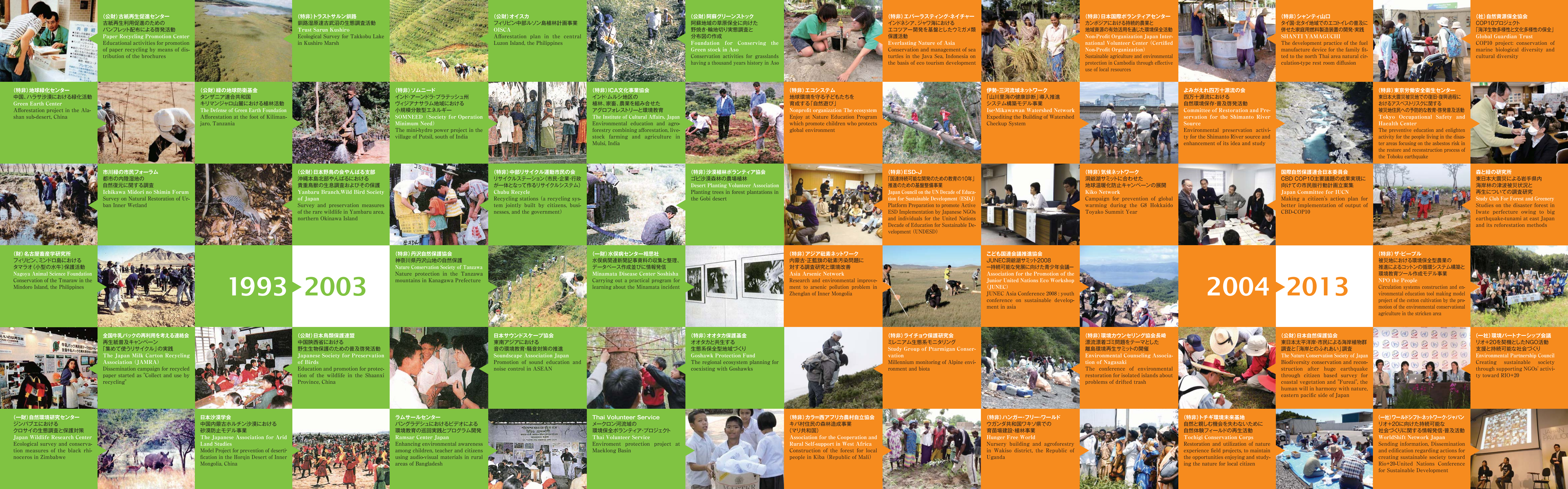
(公財)古紙再生促進センター 古紙再生利用促進のための パンフレット配布による啓発活動 Paper Recycling Promotion Center Educational activities for promotion of paper recycling by means of dis- tribution of the brochures